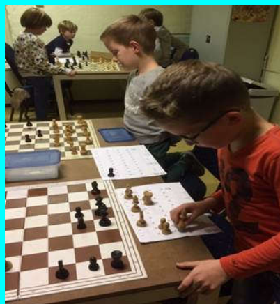
Wie wint de meeste punten?