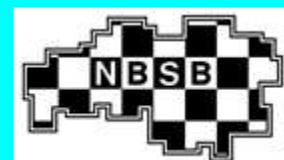
DISTRICT DEN BOSCH